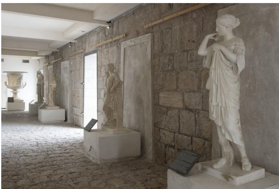
Galerie des Antiques

Le 2 décembre 2023, Maria Callas aurait eu 100 ans. Sa renommée internationale a motivé un grand nombre d'événements aux quatre coins du monde qui célèbreront la diva qu'elle a été. L'intérêt culturel de la personnalité de Maria Callas est tel que l'UNESCO s'associe aux commémorations du centenaire de la cantatrice. La Grèce, pays d'origine de Maria Callas, sera le chef d'orchestre de ces commémorations, auxquelles la France a apporté son soutien.