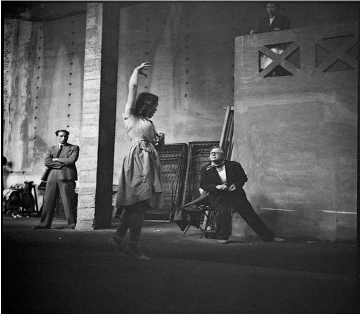
03. La compagnie Renaud-Barrault répétant Les Suppliantes au stade Roland-Garros : une femme dansant.

Le détournement humoristique, la distance ironique avec le modèle grec, l'anachronisme savamment calculé sont la marque du théâtre de Jean Giraudoux. Ses interprétations singulières de la tragédie et de la mythologie gréco-latine apparaissent dans trois pièces célèbres : Amphitryon 38 (1929), La Guerre de Troie n'aura pas lieu (1935) et Electre (1937). Cette dernière pièce est emblématique de la modernisation des mythes qu'on trouvera également chez Jean-Paul Sartre ( Les Mouches , 1943) et Jean Anouilh