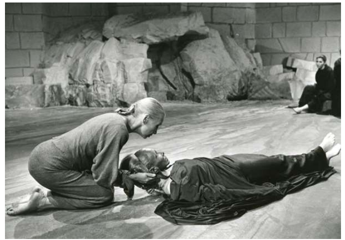
05. Silvia Monfort dans Electre de Sophocle.