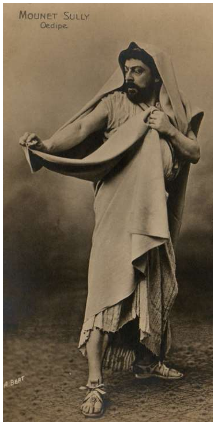
01. Jean Mounet-Sully dans le rôle d'Œdipe, carte postale.