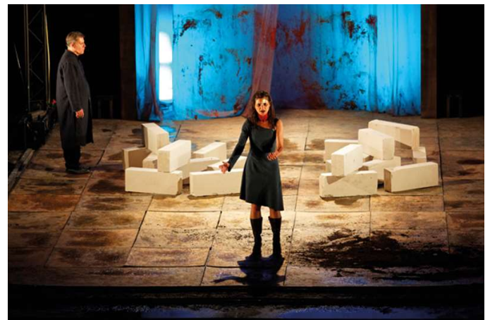
09. Wajdi Mouawad, Des femmes : Les Trachiniennes, Antigone, Électre .