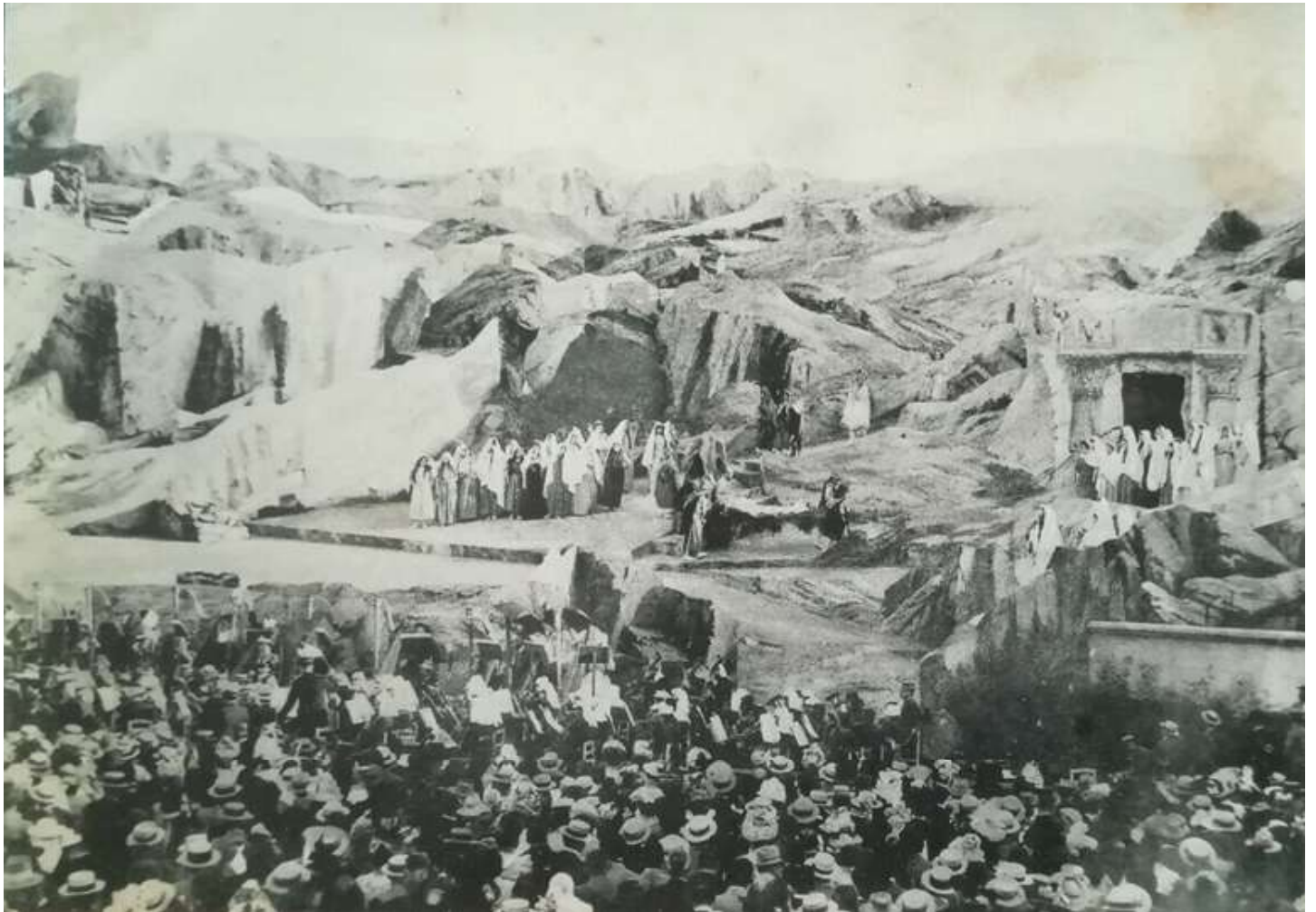
02. Prométhée , musique de Gabriel Fauré, livret de Jean Lorrain et André-Ferdinand Hérold, Arènes de Béziers, 1901 (carte postale).