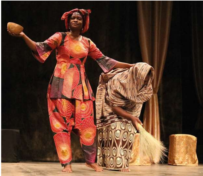
07. Antigone i ma kou , Compagnie Marbayassa, mise en scène de Guy Giroud, DR.