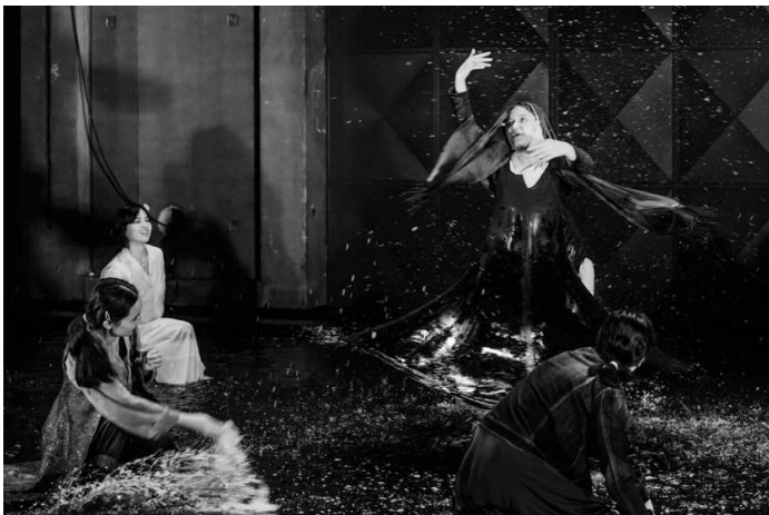
08. Les Messagères , d'après Sophocle, mise en scène de Jean Bellorini, TNP, Villeurbanne, 2023,

Antigone est parfois associée à d'autres tragédies de Sophocle dans des créations originales. En 2019, lors du Festival d'Automne de Paris, la chorégraphe Carolyn Carlson et le metteur en scène Gwenaël Morin proposent Uneo uplusi eurstragé dies , spectacle basé sur la combinaison des trois tragédies de Sophocle Ajax-Antigone-Les Trachiniennes . Il faut rappeler aussi les créations de l'écrivain et dramaturge Wajdi Mouawad, auteur d'une série de pièces inspirées par Sophocle entre 2011 et 2015 : Des femmes (2011), Des héros